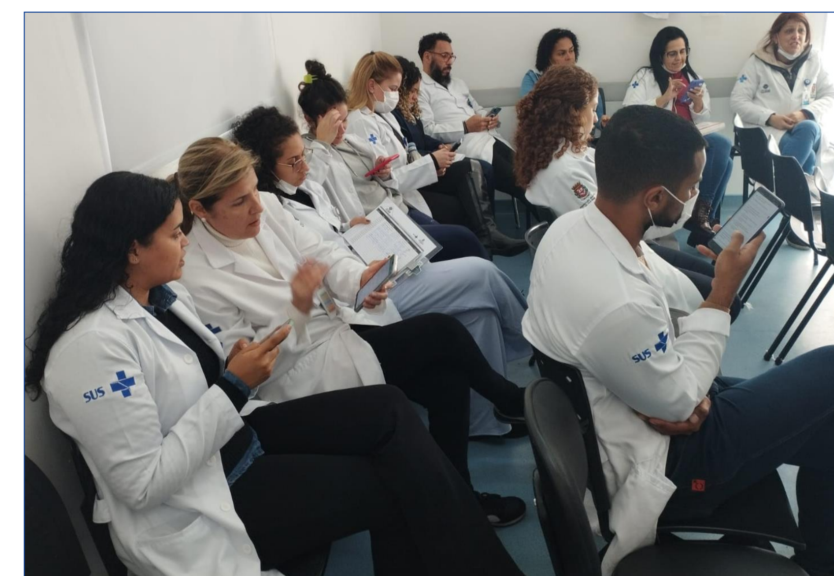
Fig. 3 – Aplicação do Quiz