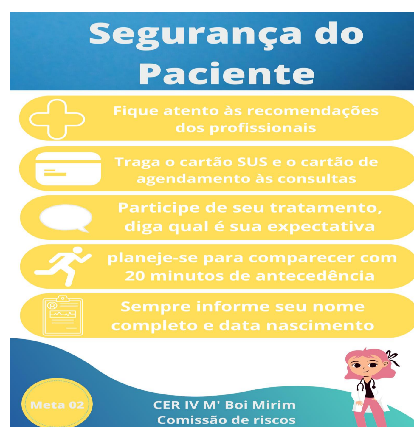
Fig. 2 – Cartaz de Comunicação com o Paciente