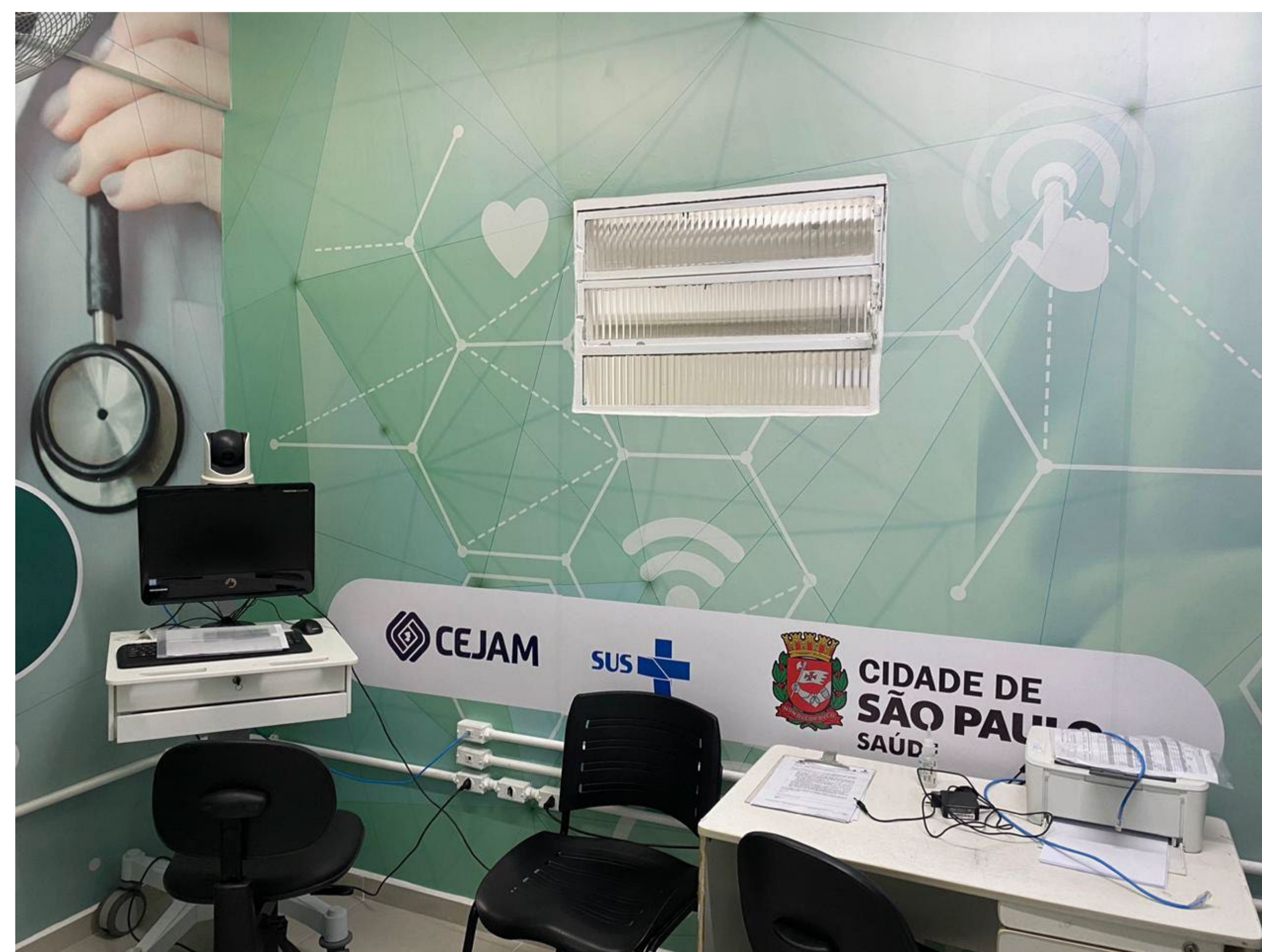
Figura 1: Consultório Digital UBS São Bento

Descrever o processo de implantação da telepsiquiatria na atenção primária à saúde (APS) nos distritos do Capão Redondo e Jardim Ângela, na zona sul de São Paulo.