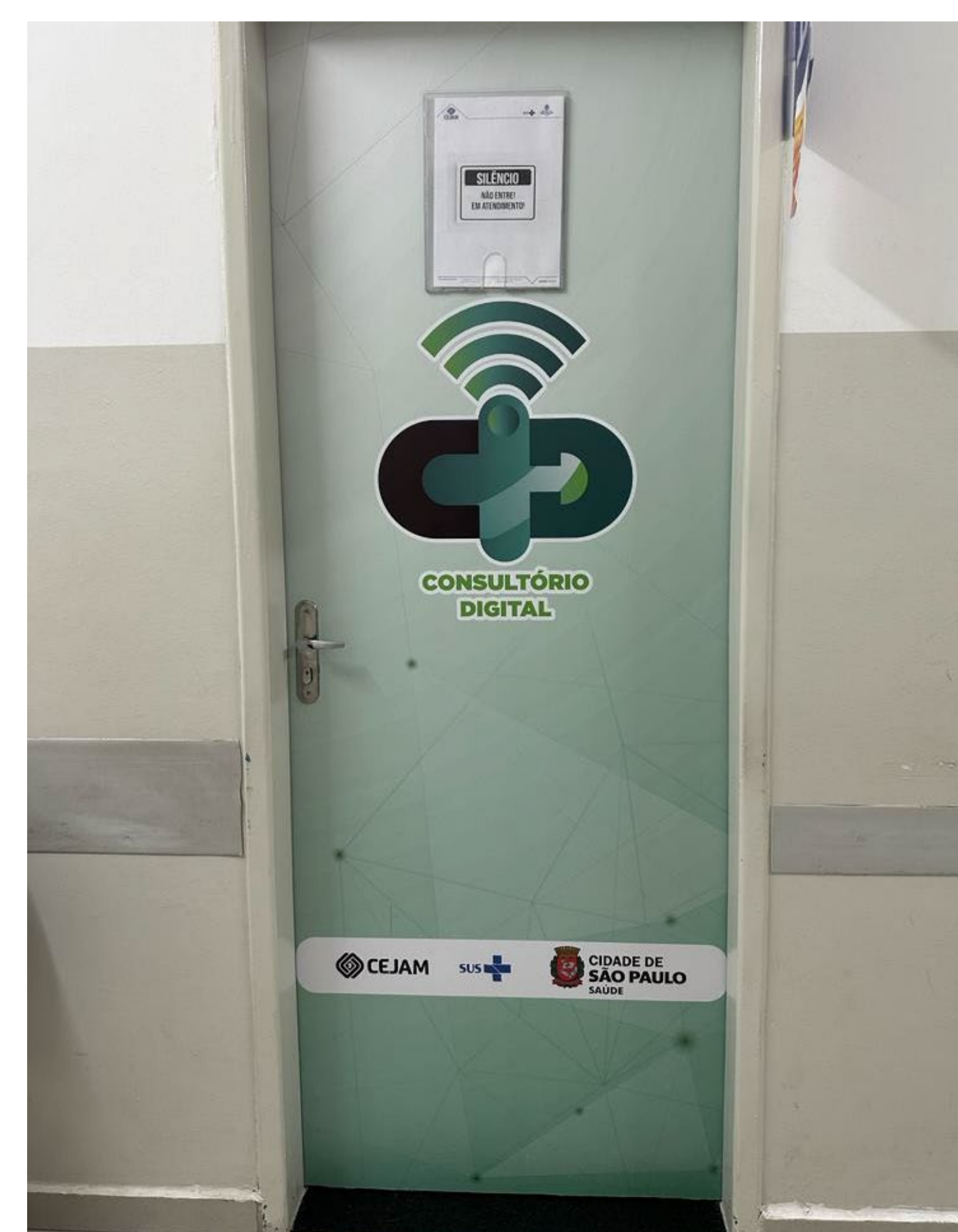
Figura 3: Consultório Digital UBS São Bento - Reprodução